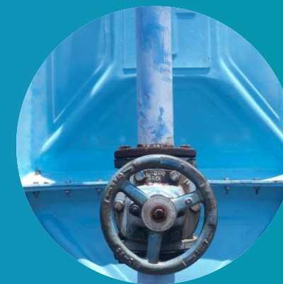
Budovanie systému verejných vodovodov